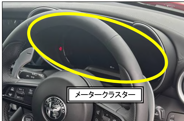
メータークラスター