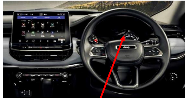
メータークラスター (不具合発生部位)