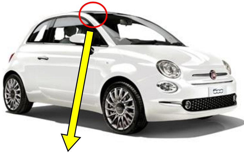
運転者席側サンバイザ